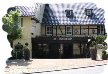
Waldhotel "Im Wiesengrund"